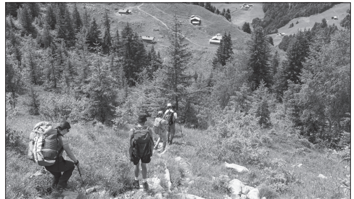
Doc. 2 La Clusaz, l'été.