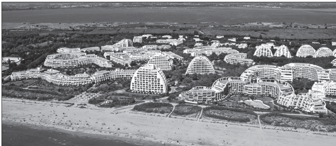
Doc. 4 Vue aérienne.

5. Pourquoi y a-t-il un décalage entre le nombre d'habitants à l'année et le nombre de logements ?