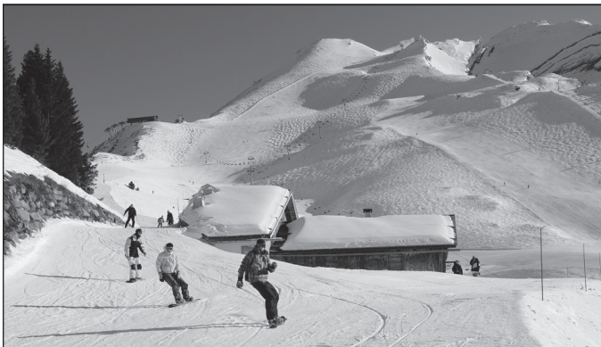
Doc. 1 La Clusaz, l'hiver.

Je découvre différents espaces touristiques.