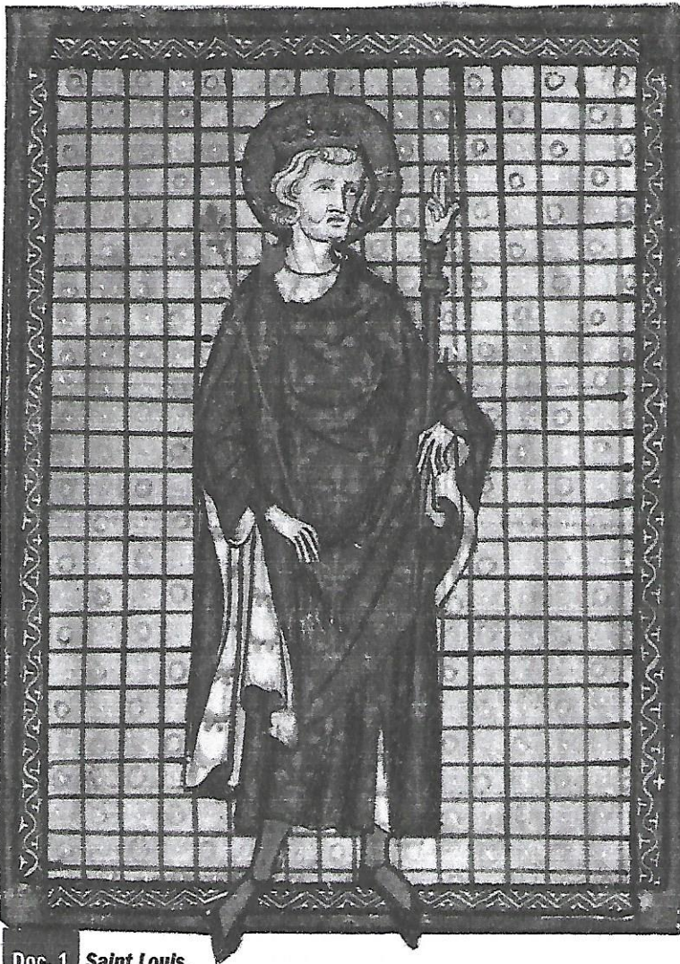
Doc. 1 Saint Louis , roi de 1226 à 1270, miniature, fin XIII e siècle.