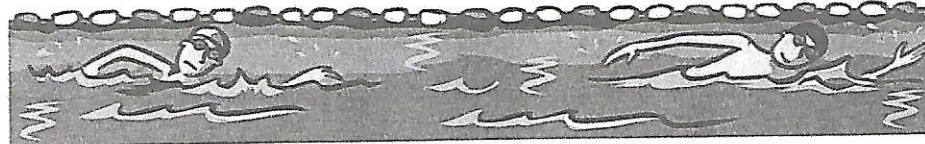
50 mètres nage libre homme 21 secondes et 64 centièmes