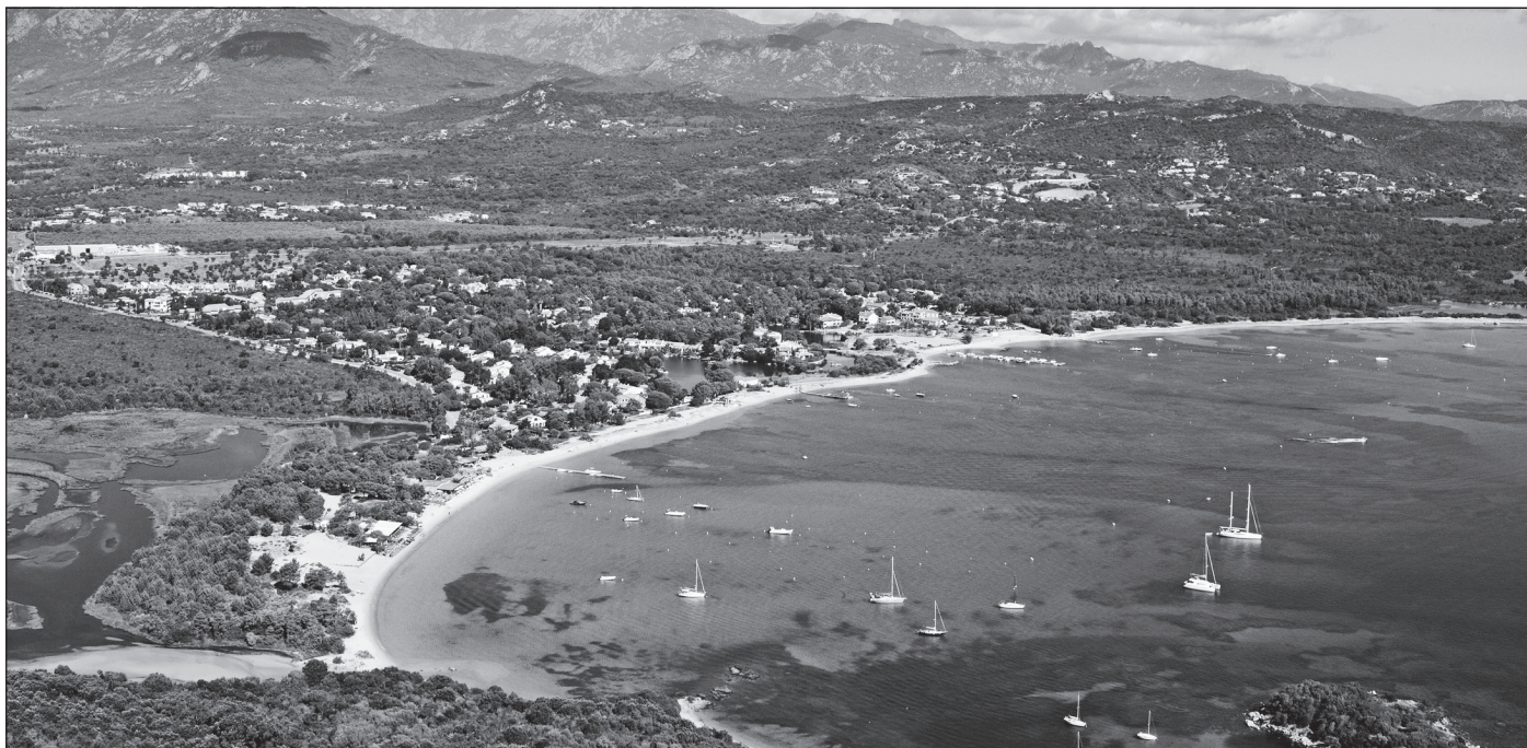
Doc. 1 Le littoral corse.

J'observe la fréquentation touristique en Corse.