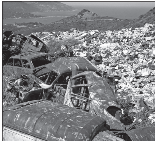
Doc. 5 Une décharge municipale en Corse.