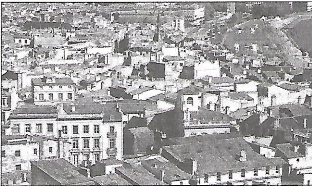
1 Le quartier du centre-ville.