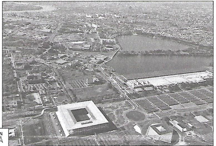
2 Le quartier de Bordeaux-Lac, sur la rive gauche de la Garonne, au nord de la ville.