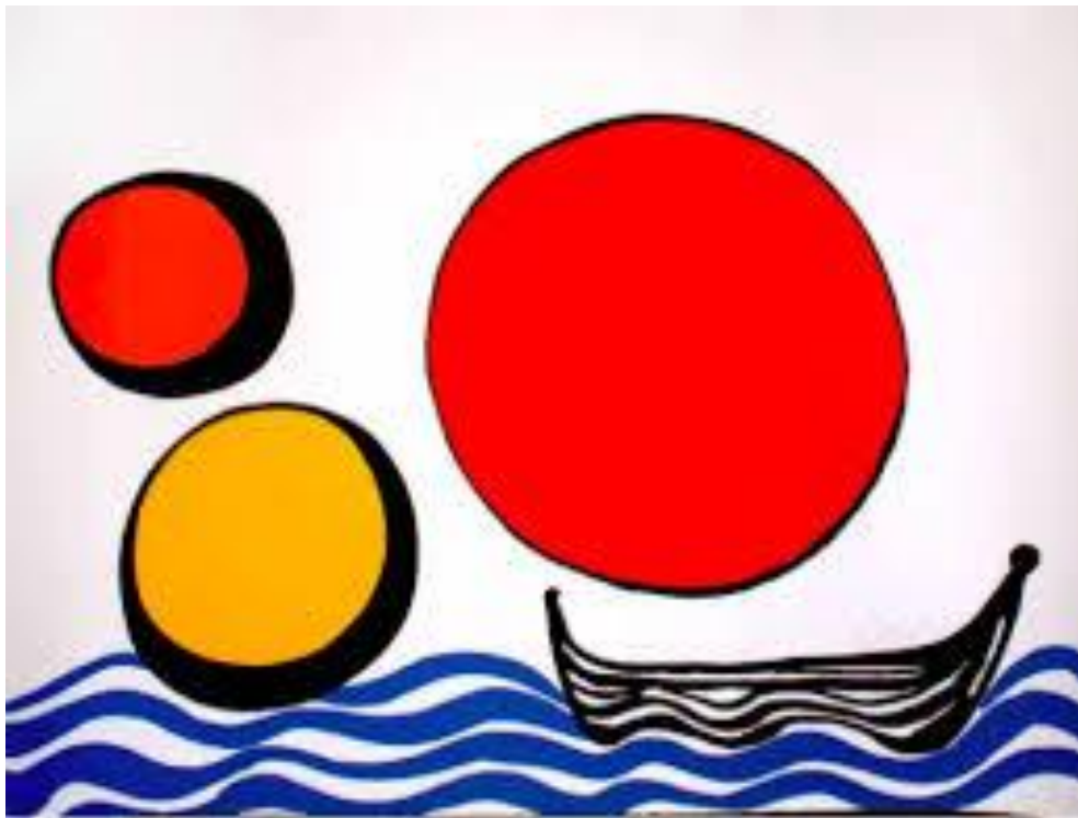
Œuvres d' Alexandre Calder