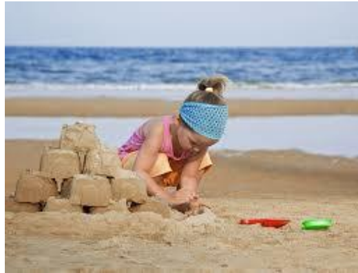
A la mer